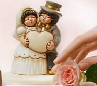
LOVE Coppia di porcellana decorata a mano, Thun .