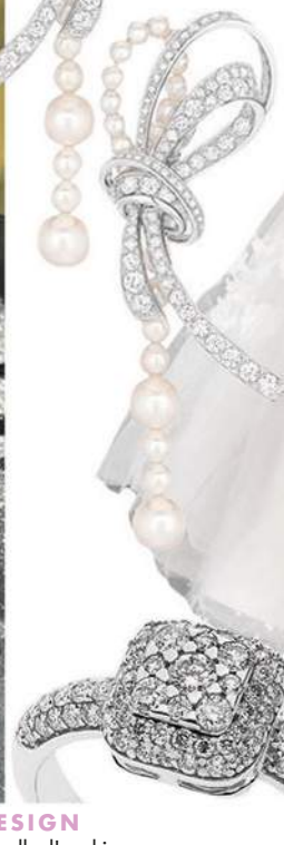
DESIGN L'anello d'oro bianco con pavé di diamanti, Comete Gioielli (1.338 euro).