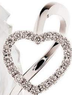
CUORE Anello d'oro bianco con pavé di diamanti, Polella (468 euro).