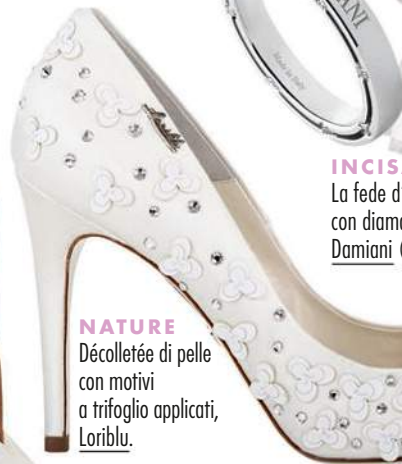
NATURE Décolletée di pelle con motivi a trifoglio applicati, Loriblu .