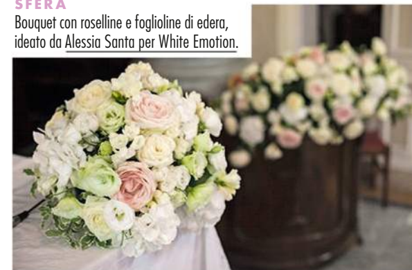
SFERA Bouquet con roselline e foglioline di edera, ideato da Alessia Santa per White Emotion .