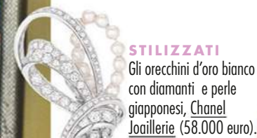
STILIZZATI Gli orecchini d'oro bianco con diamanti e perle giapponesi, Chanel Joaillerie (58.000 euro).