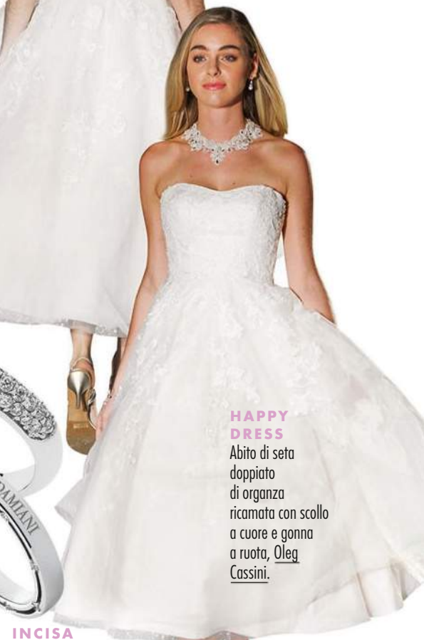
HAPPY DRESS Abito di seta doppiato di organza ricamata con scollo a cuore e gonna a ruota, Oleg Cassini .