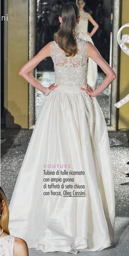
COUTURE Tubino di tulle ricamato con ampia gonna di taffetà di seta chiusa con fiocco, Oleg Cassini .