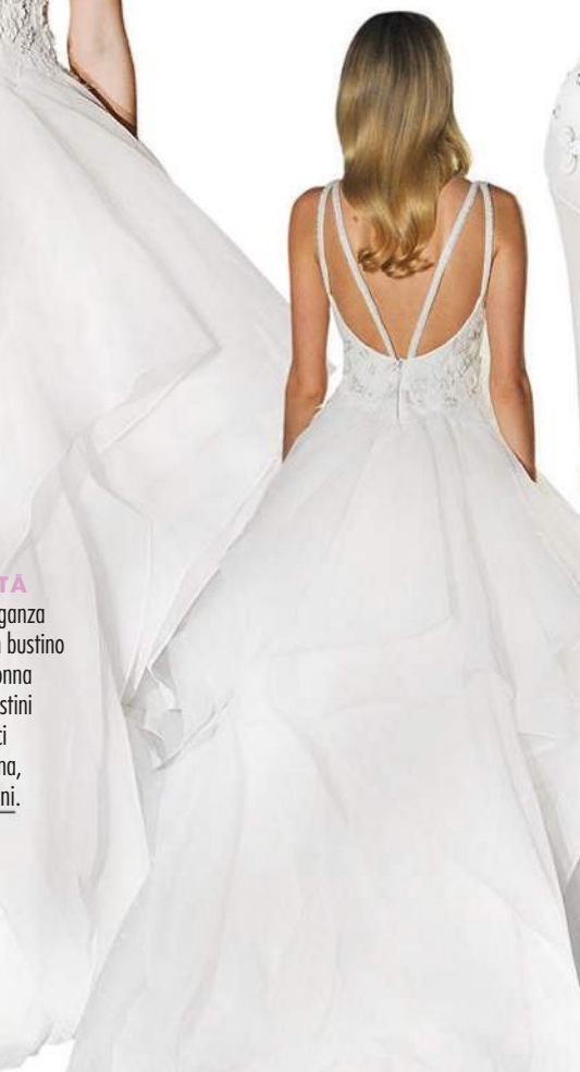
ALTA SOCIETÀ Abito di organza di seta con bustino fiorito e gonna origami. Listini asimmetrici sulla schiena, Oleg Cassini .